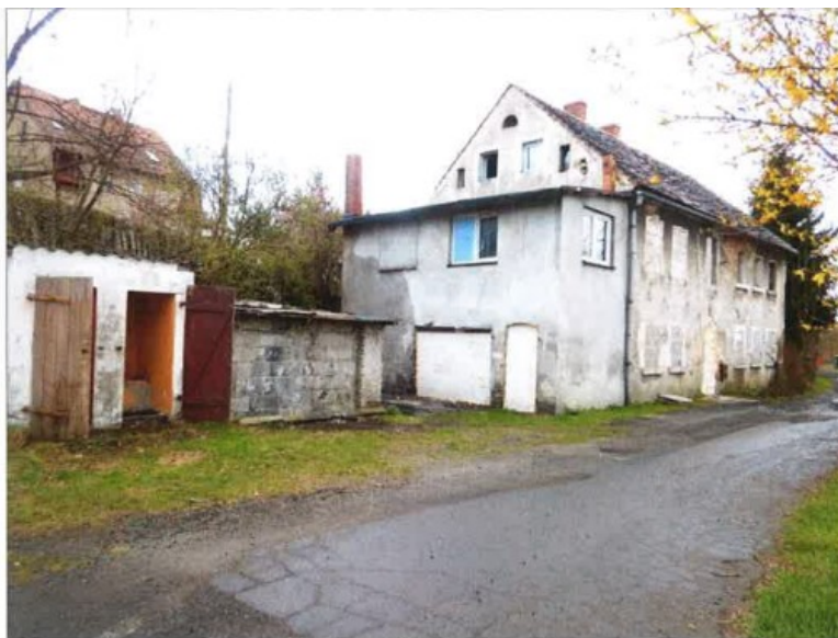
Ogólny widok nieruchomości.

Opis nieruchomości: Nieruchomość gruntowa położona w pośredniej strefie lokalizacyjnej miasta, w sąsiedztwie zabudowy mieszkaniowej jednorodzinnej i wielorodzinnej przy ulicy Na Skarpie. Nieruchomość gruntowa o kształcie wydłużonego wielokąta położona na niewielkim skłonie o wystawie północno-zachodniej. Na działce nr 41 zlokalizowany jest budynek mieszkalny oznaczony numerem porządkowym „2”. Z uwagi na bardzo zły stan techniczny, wykluczający budynek z dalszej eksploatacji, został on wyłączony z użytkowania i zabezpieczony przed wejściem osób postronnych. Zgodnie z ekspertyzą sporządzoną przez osobę posiadającą uprawnienia budowlane w specjalności konstrukcyjno-budowlanej do projektowania i kierowania robotami budowlanymi, przeprowadzenie jakiegokolwiek remontu kapitalnego w obecnym stanie technicznym budynku jest nieuzasadnione z uwagi na rachunek ekonomiczny i jedynym racjonalnym rozwiązaniem jest likwidacja obiektu poprzez jego rozbiórkę. W związku z powyższym budynek nie podlega wycenie. Budynek przeznaczony jest do rozbiórki własnym staraniem i na własny koszt Nabywcy, po uprzednim uzyskaniu przez Nabywcę na swój koszt wszelkich decyzji administracyjnych niezbędnych do przeprowadzenia prac rozbiórkowych.